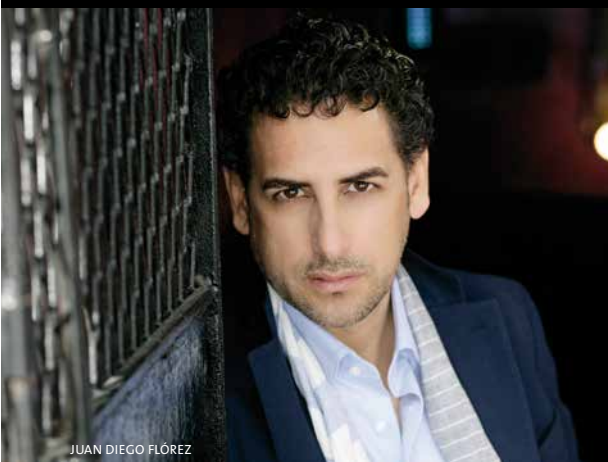
JUAN DIEGO FLÓREZ