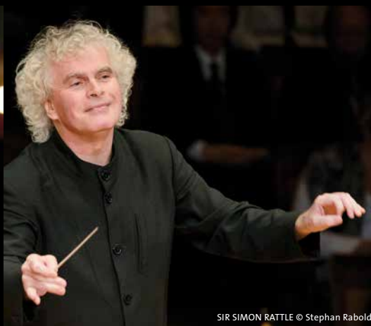
SIR SIMON RATTLE