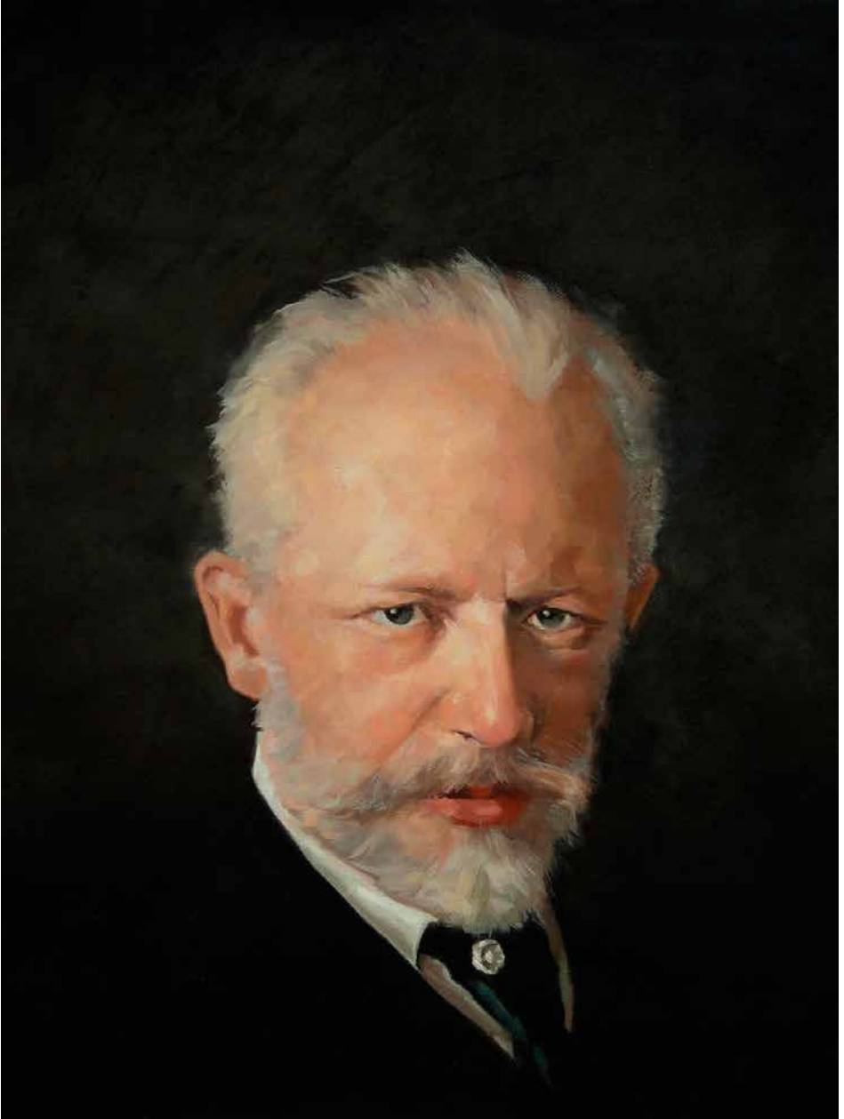
P. I. CHAIKOVSKI. Detalle del retrato de Nikolai Dimitriyevich Kuznetsov