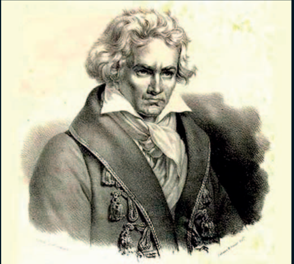
L. van Beethoven, litografia de Ibert Newsam